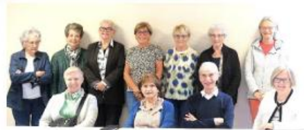
Réunion à l'atelier Mémoire