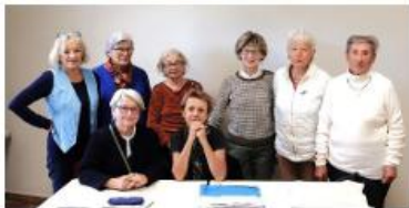
Une partie des inscrits à l'atelier Ecriture

S'inscrire à A.Defretin au 04.90.25.57.80 ou 06.11.97.47.71