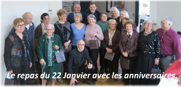
Le repas du 22 Janvier avec les anniversaires.

Pour ce premier repas de l'année, la salle du Foyer était encore pleine, les convives étaient heureux de se retrouver, et toujours dans une ambiance festive.