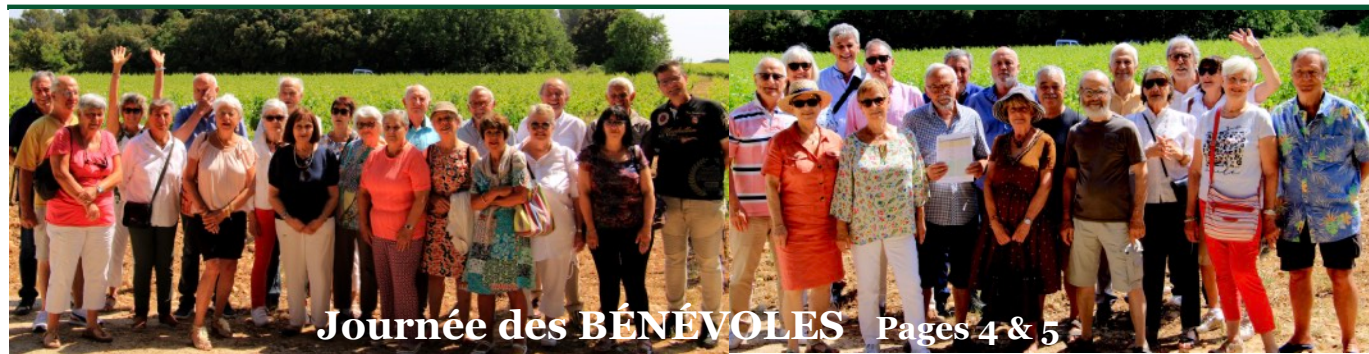
Journée des BÉNÉVOLES Pages 4 & 5