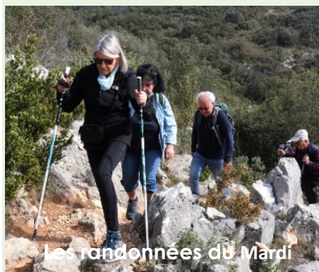
Les randonnées du Mardi