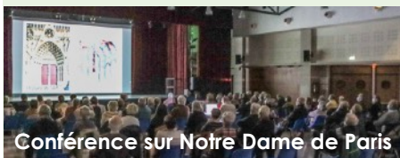
Conférence sur Notre Dame de Paris