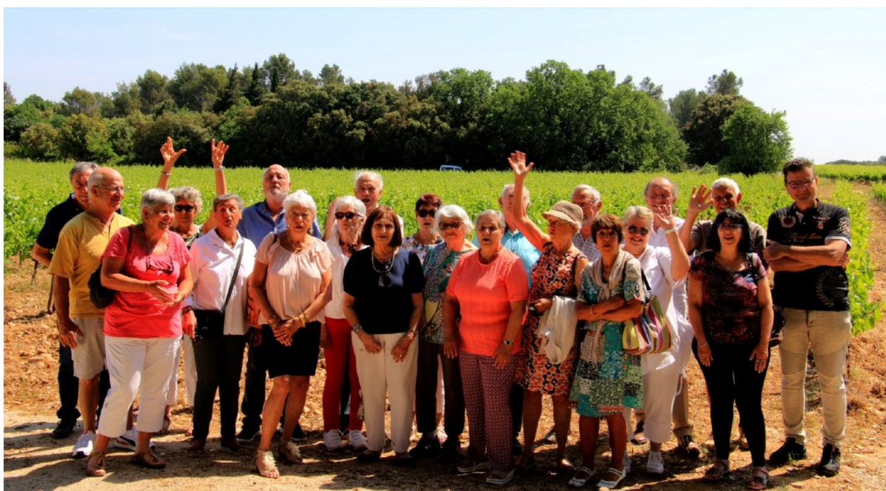
L'équipe de bénévoles presque au complet