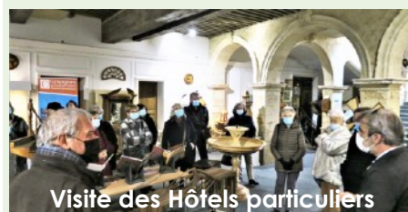
Visite des Hôtels particuliers