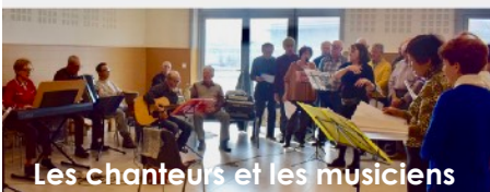
Les chanteurs et les musiciens